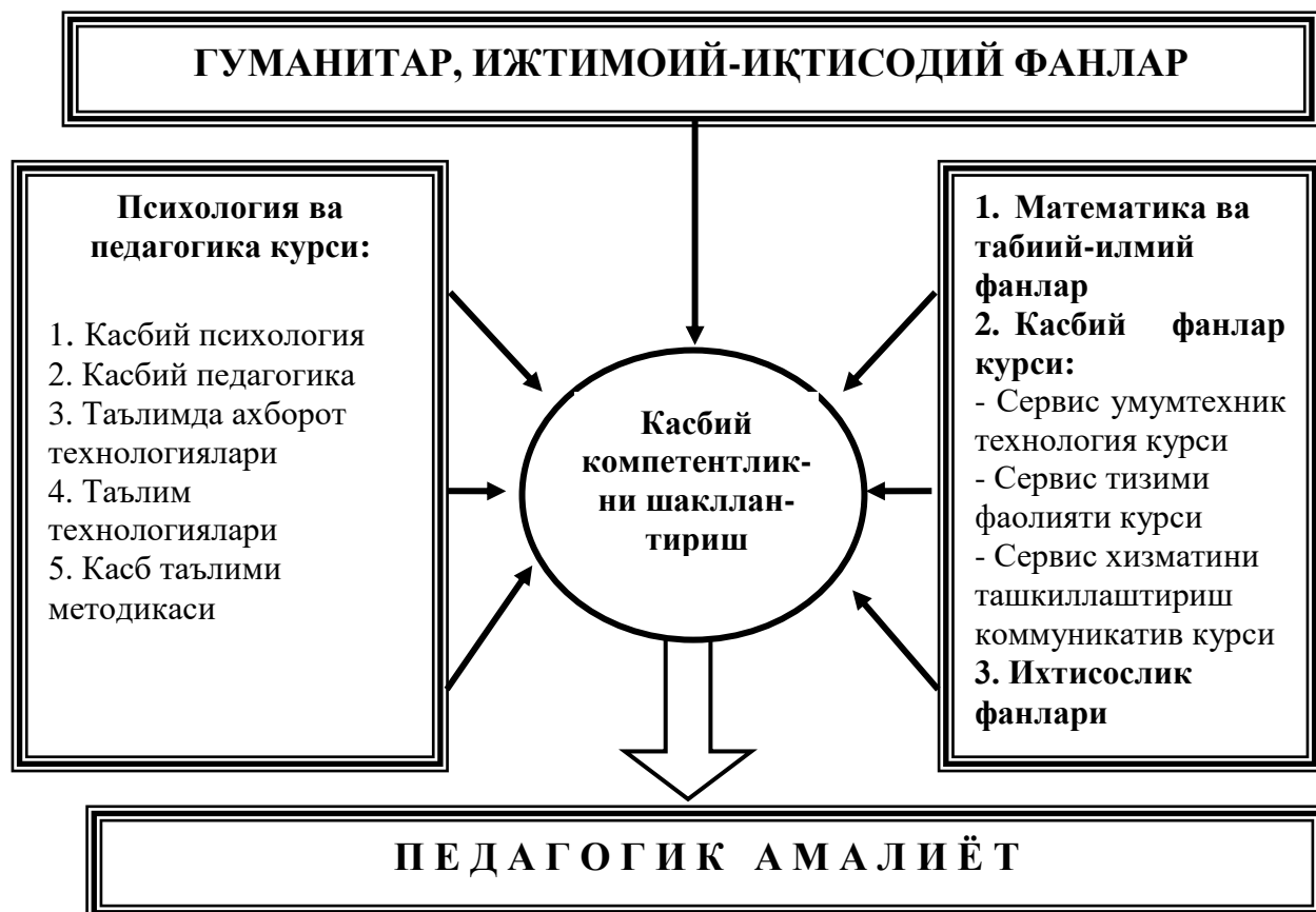
2-расм. Касб таълими ўқитувчилари касбий компетентлигини шакллантиришда педагогик ва техник билимлар интеграцияси

Юқорида санаб ўтилган фанлар касб таълими методикаси фани мазмунида интеграциялашиб, педагогик амалиёт жараёнида ўз татбиқини топади (2-расм). Бундан хулоса чиқариш мумкинки, касб таълими методикаси фани ўқитувчининг касбий компетентлигини шакллантиришда интеграциялаштирувчи аҳамиятга эга бўлиб, уни мазмунан таркиб топтиришда ўқув режасига кирувчи барча фанлар хусусиятлари эътиборга олинади.