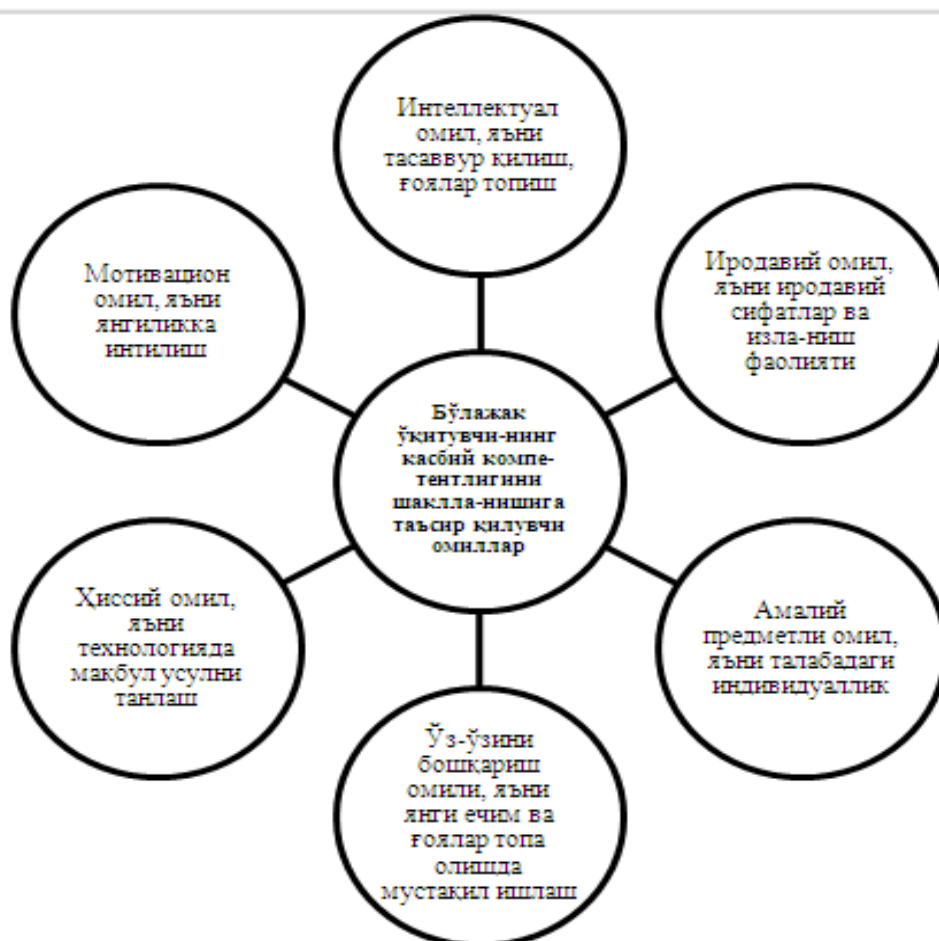
1-расм. Бўлажак ўқитувчининг касбий компетентлигини шаклланишининг таркибий тузилмаси

Н.А.Муслимов ва Қ.М.Абдуллаевалар ўз тадқиқотларида касб таълими йўналишидаги бўлажак ўқитувчиларни тайёрлаш жараёнида ижодкор ўқитувчининг индивидуаллик таркибий тузилмасини ишлаб чиққанлар [21, 46]. Бу тузилмада Касб таълими йўналишидаги бўлажак ўқитувчининг касбий компетентлигини шаклланишига таъсир этувчи омиллар аниқланди. Тузилма қуйидаги таркибий қисмлардан иборат (1-расм).